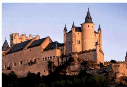
1. Замок Альказар, Испания